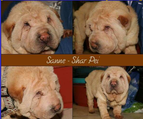
Sanne - Shar Pei