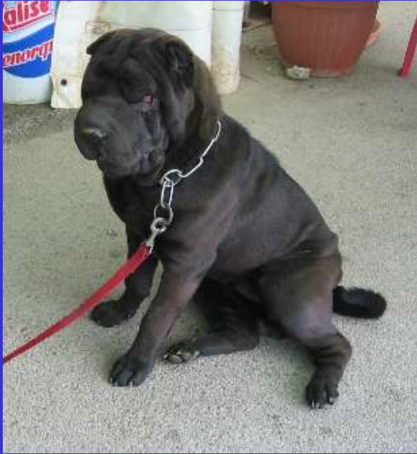
LIAM noch in Spanien